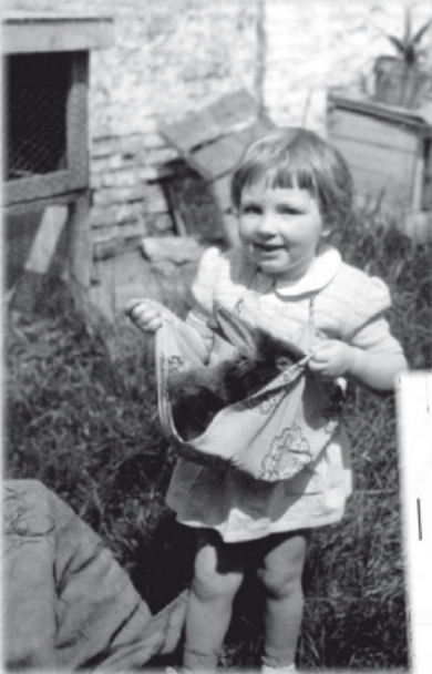
Dochter Verwulgen met een baardkonijn in haar schoot. De foto dateert van begin jaren '60.

Van 10 tot 12 november 1961 werden op de internationale pluimveetentoonstelling in het Feestpaleis in Gent 1 oude ram en 4 jonge voedsters ter erkenning geschouwd en dat onder de naam 'Gentse Baard'. Deze presentatie deed en doet nog altijd heel wat stof